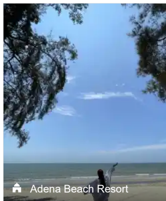
Adena Beach Resort

Pasir Putih at Adena Beach Resort , Kuantan