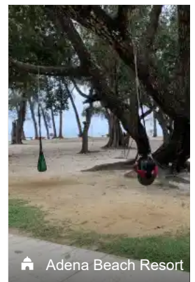
Adena Beach Resort