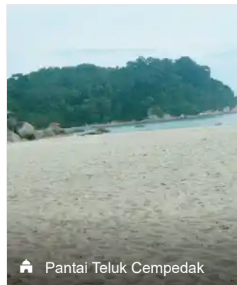
Pantai Teluk Cempedak

Pasir Putih at Adena Beach Resort , Kuantan