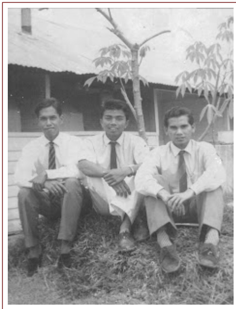
Bergambar berhampiran paip tempat mandi di hadapan bilik kami di Sekolah Kebangsaan Padang Tengku 1961.