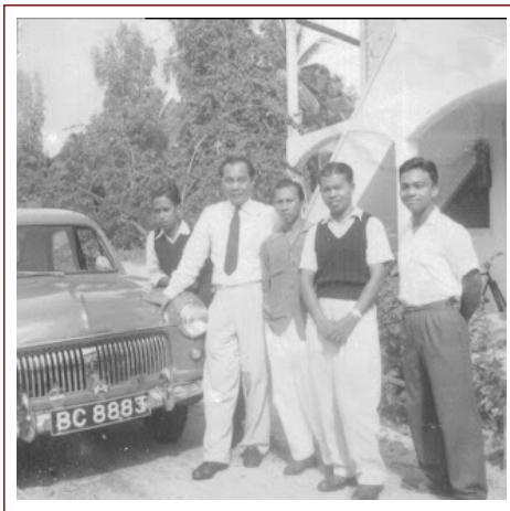
Suatu pagi 1954 di Sekolah Melayu Laki-laki Kuantan