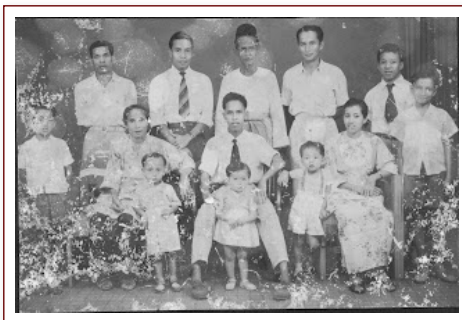
Bergambar ramai sebelum melanjutkan pengajian ke SITC (1957) Maklumat Awal

Sebagaimana biasa, Emak dan Encik membuat kenduri kesyukuran dan arwah pada malam yang keesokan harinya saya akan meninggalkan kampung. Jemputan sebagaimana biasa: saudara-saudara keliling rumah. Abang Asiah yang paling banyak membantu dalam hal masak-memasak. Malam itu juga Abang Asiah tolong menggosok baju dan seluar saya menggunakan seterika arang. Seterika itu dia yang punya kerana kami tidak mempunyai seterika.