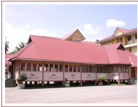
Sekolah Melayu Ganchong (dibina 1910)

Sekolah Melayu (SM) Ganchong adalah salah sebuah sekolah yang tertua di daerah Pekan, tetapi bukanlah sekolah yang pertama di bina baik di Pahang mahupun di Pekan. SM Ganchong dibina pada 1910.