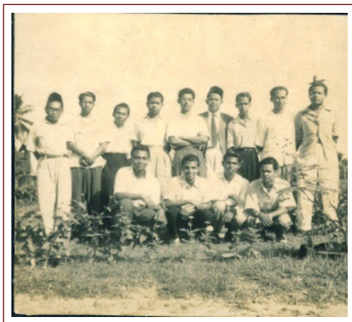
Gambar sebahagian daripada guru Sekolah Melayu Laki-laki Kuantan (1956)